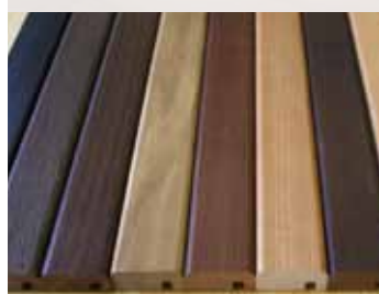
Rôzne farebné prevedenia