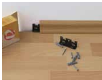
Montážne prvky pre lišty