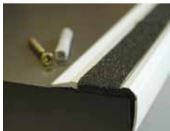
S protišmykovou vložkou