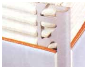
Profil vonkajší roh - PVC, hliník