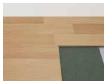
Drevotlákňitá doska skladacia