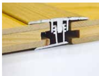
So základovým profilom