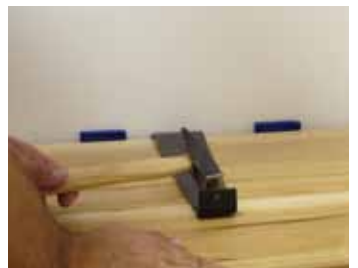
Montážny kit pre drevené parkety