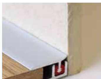
S konkávnym zákl. profilom