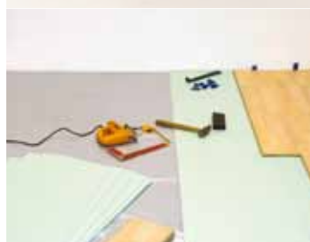
Izo-Floor dosky 6 mm