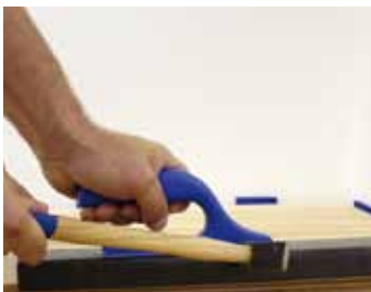
Dorážací plast s držiakom

Pre ľahšiu montáž drevených parkiet, laminátových podláh a iných druhov podláh sa používajú rôzne pracovné nástroje. Je dôležité, aby ste používali iba originálne príslušenstvo, ktoré všetky sú ponúkané našou spoločnosťou.