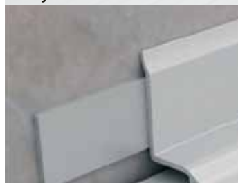
Profil kúpeľňový - PVC biely samolepiaci