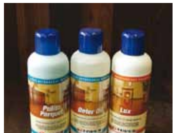
Čistiace a udržiavacie prostriedky