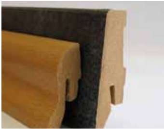
Ukončovacie lišty MDF

Ku každej laminátovej podlahe alebo parketám ponúkame zodpovedajúce ukončovacie lišty. Lišty sú vyrobené z rôznych materiálov (drevo, MDF, PVC) a môžu byť inštalované prostredníctvom priskrutkovania na stenu alebo použitím upevňovacích prvkov. K dispozícii sú rôzne rozmery.