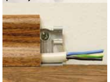
Montážne prvky pre lišty