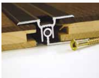
So zákl. profilom "TRIO GRIP"