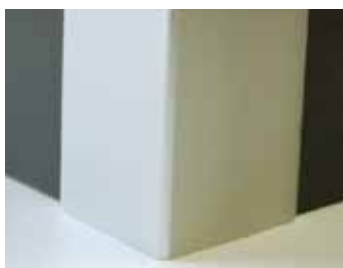
Vonkajší rohový ochranný profil