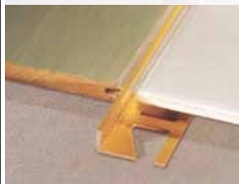
Dilatačný profil - hliník