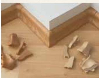
PVC prvky pre MDF-lišty