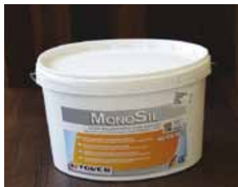
MONOSIL - jednozložkové lepidlo na báze silanu