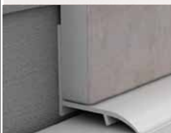
Profil kúpeľňový - PVC vstavaný, biely