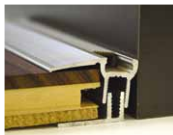
So zákl. profilom "TRIO GRIP"