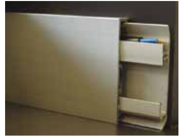
ALU ukončovacie lišty