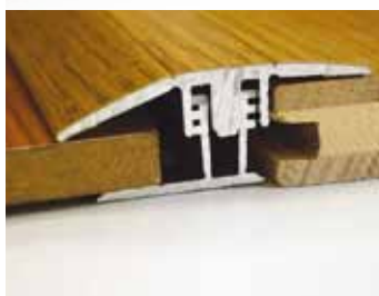
So zákl. profilom