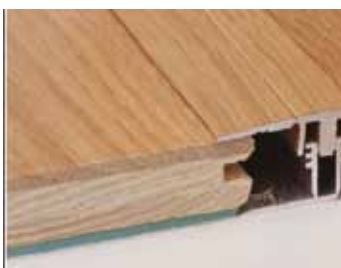
S L-zákl. profilom