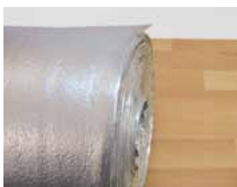
PE podložka s ALU fóliou

Podložky sa používajú ako hluková, tepelná a hydro-izolácia pri montáži Vašich tzv. plávajúcich podláh – laminátových a panelových drevených parkiet. Výberom optimálnej podložky sa vyrovnávajú drobné nerovnosti podkladu a izoluje sa nepríjemný krokový hluk.