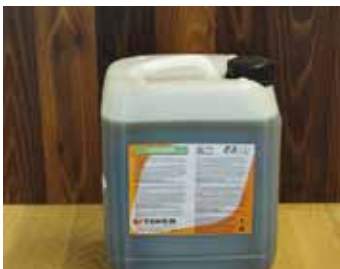
TOVERFIX - K1 vodoodporno konsolidirajúce sredstvo

Pri úplnom lepení našich drevených parkiet na podklad (hlavne betónový), používame iba vysokokvalitné lepidlá, ktoré sú vhodné na lepenie drevených parkiet. Používanie iných lepidiel môže byť dôvodom k reklamácii! Olejovanie parkiet je špeciálna technika ochrany podlahy. Odporúčame Vám konzultáciu s odborníkom pred začatím olejovania. Používanie rôznych zodpovedajúcich prípravkov na čistenie a údržbu parkiet, Vám umožní udržať podlahu krásnu po dlhé roky. Pre každý druh podláh Vám ponúkame optimálne čistiace a udržiavacie prostriedky.