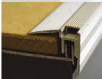
So zákl. profilom "TRIO GRIP"