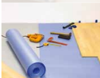
Izo-Floor termo rolky