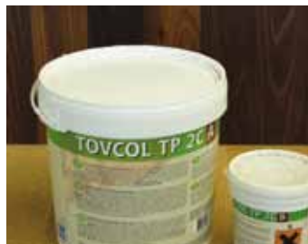
TOVCOL TP 2C A/B - dvojzložkové epoxy-polyur. lepidlo