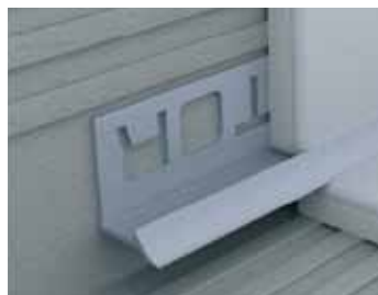
Profil vnútorný roh - PVC, biely