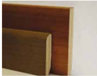
Drevené ukončovacie lišty