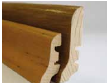
Drevené ukončovacie lišty