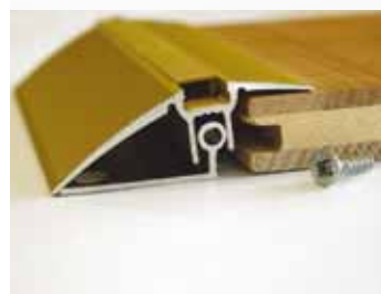
So zákl. profilom "TRIO GRIP"