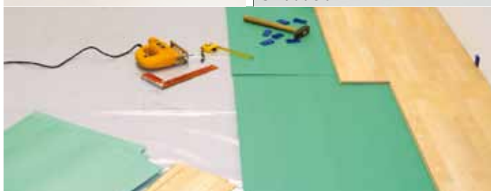
Izo-Floor dosky 3 mm